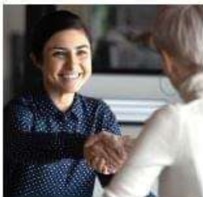
Des collaborateurs au service de chacun.

— Le rédacteur d'actes (ancien clerc de notaire) a pour tâche de rédiger