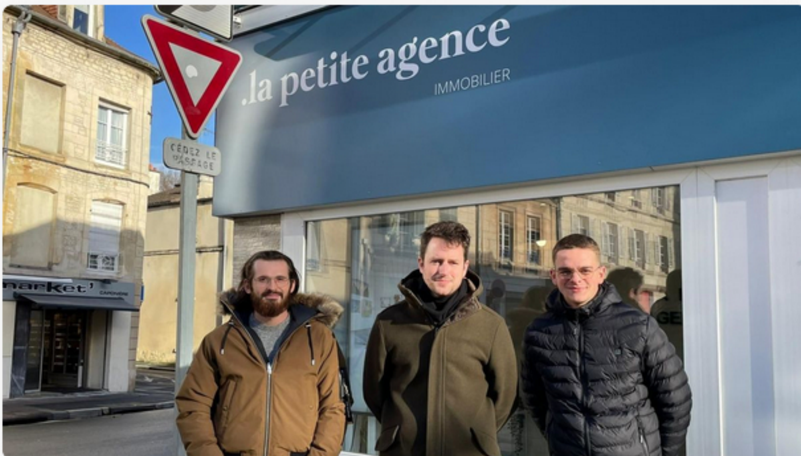
Ces agents immobiliers de Caen sont confiants pour l'année 2024.

Le marché de l'immobilier va-t-il enfin retrouver des couleurs ? Après de longs mois de hausse, on se dirige vers une baisse des taux pour les crédits immobiliers ! Une bonne nouvelle pour la profession et les acquéreurs puisqu'une stabilisation autour de 4% est envisagée lors du premier trimestre 2024.